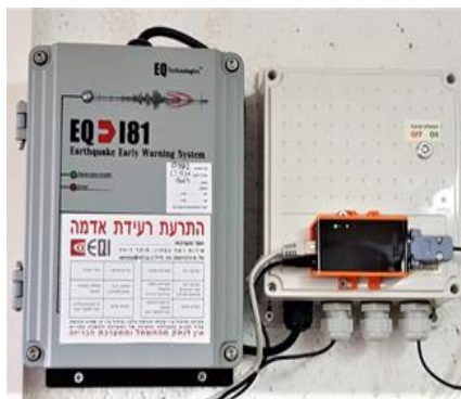
EQ1, רשף ביטחון EQ Earthquake Ltd, Earthquake Alert™ ישראל