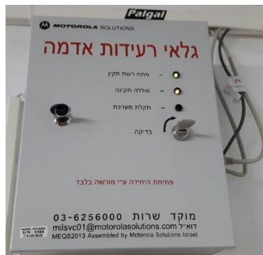
מוטורולה ICP DAS CO Ltd, SAR-713 טאיוואן