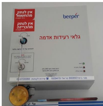
ביפר A-2 Corp Ltd HS-301 יפן