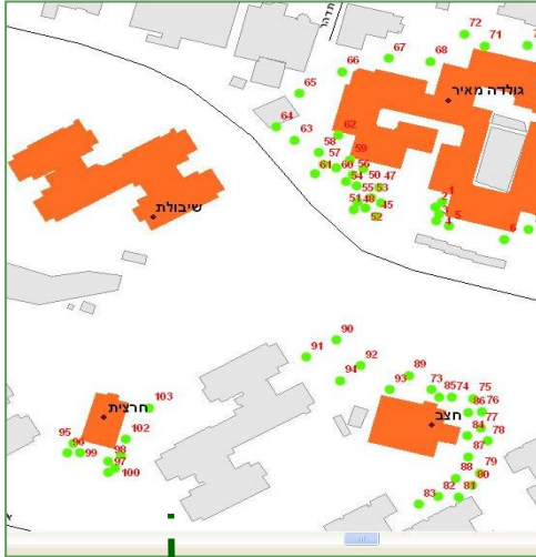
מיפי העצים בשטח בית הספר והצבתם על מפה.

כל מוסד חינוכי יודע כמה כיסאות יש במוסד, כמה ספסלים בחצר, כמה עמודי חשמל ואפילו כמה פחי זבל. אלא שסביר להניח שמספר העצים אינו רשום ואין גם מעקב רשום אחרי הטיפול בעצים. חשיבות הסקר הוא ביכולת לנהל את העצים והטיפול בהם: לדעת את מצבם, לעקוב אחר דרישות טיפול וביצוען.